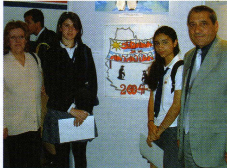
Ganadora 1er. Premio y Ganadora Mención del Concurso Posters 2004 junto a sus trabajos acompañados de familiares.