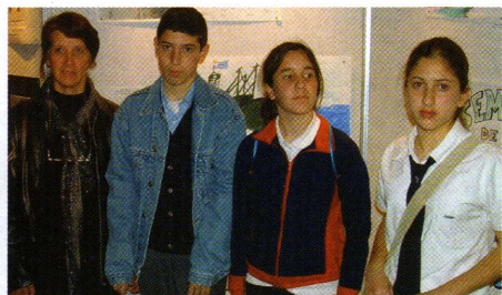
Ganadora de Mención del Concurso Posters