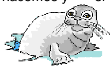
Marosa, la foca curiosa

Bueno, me cansé de escribir hoy y además se me llenó el espacio, así que en otra redacción sigo contando cosas de la Antártida.