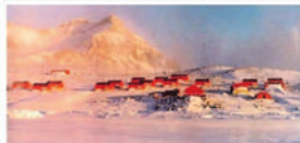
Base Esperanza Argentina

Radio Antarkos 98.7 FM, participó en la Primera Emisión antártica sudamericana de tres naciones del Cono Sur, organizada por el Programa "Más allá del Sur", transmitido por LRN en AM 870, desde Buenos Aires.