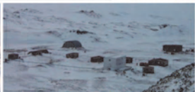
Base Artigas Uruguay