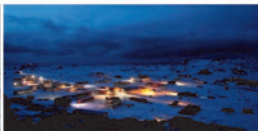
Base Frei Chile