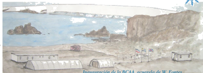
Inauguración de la BCAA, acuarela de W. Fontes