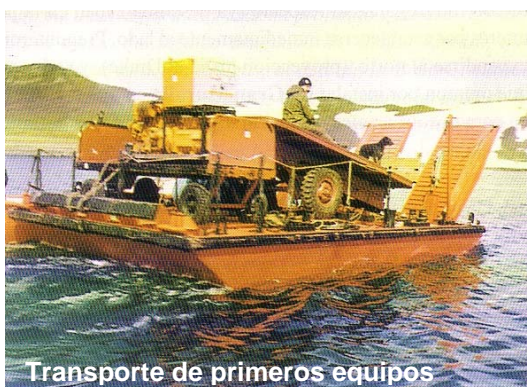
Transporte de primeros equipos

En un refugio improvisado con paneles para la construcción de los módulos y cajones en la playa de Base Marsch los uruguayos campeaban el temporal antártico y se deleitaban con el guiso de poroto enlatado templado en calentadores individuales de alcohol, a la espera que