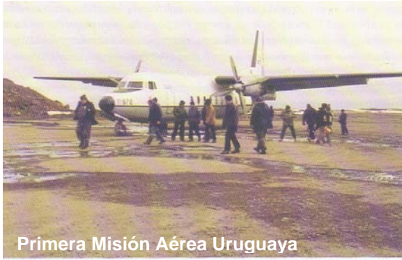
Primera Misión Aérea Uruguay

camino elegido para intentar el ingreso como miembro pleno la Tratado Antártico, con un margen razonable de éxito.