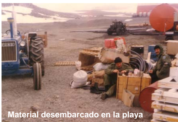
Material desembarcado en la playa