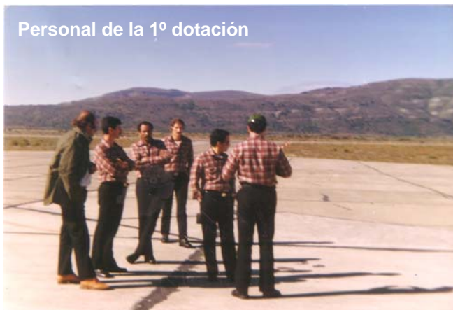
Personal de la 1º dotación

Con personal del mismo, tenía la misión de reunir y preparar los medios para su posterior envío a través de la F. A. U. a la Isla Rey Jorge. Los recursos financieros no permitían cubrir toda la operación, por lo que fue necesario usar la imaginación para abaratar costos.