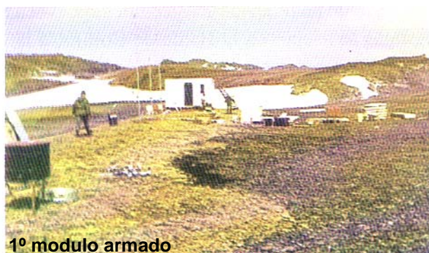
1º modulo armado

De inmediato se armó un galpón de uso general y depósito y otro más pequeño para ser usado como laboratorio.