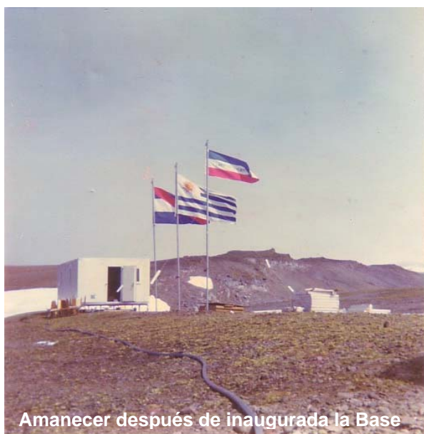
Amanecer después de inaugurada la Base

generador de energía, que era necesario apagar en las horas de descanso, no había baños se usaban los químicos y otras muchas mas, pero todo esto era superado por un enorme espíritu de cuerpo y la ejemplarizante conducción del jefe de esta expedición.