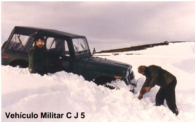
Vehículo Militar C J 5

Habiendo realizado el primer vuelo histórico a la Isla Rey Jorge, sin mayores contratiempos se abre el camino para iniciar las tareas de preparación para poner en práctica los planes de la construcción de la base.