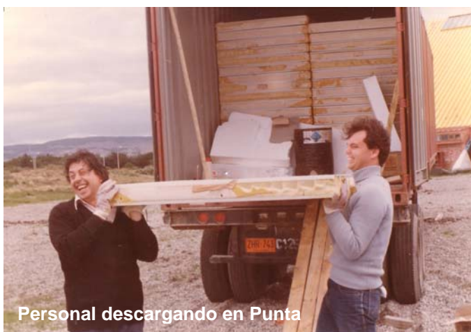
Personal descargando en Punta

La comida fue provista por el S. I. E. en forma de ración de combate, queso y dulce de membrillo.