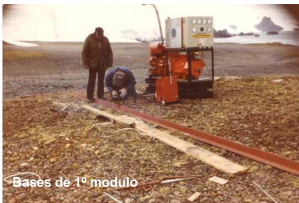
Bases de 1º modulo

El día 13 de diciembre se inicia la construcción del primer modulo que dará refugio al contingente uruguayo ya que hasta ese momento en el lugar de emplazamiento de la base solo existía un pequeño refugio chileno, para cuatro personas.