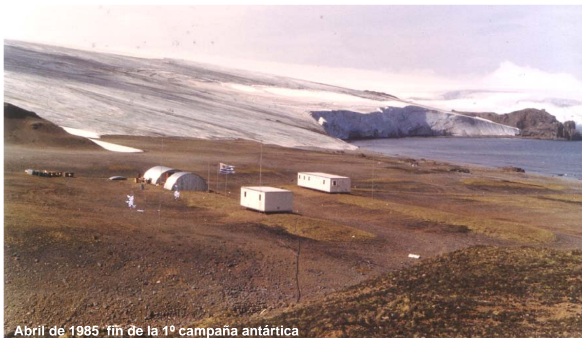
Abril de 1985 fin de la 1º campaña antártica

Fue así, que en el relativamente corto lapso de dos semanas, la Base Científica Antártica Artigas era una hermosa y palpable realidad.